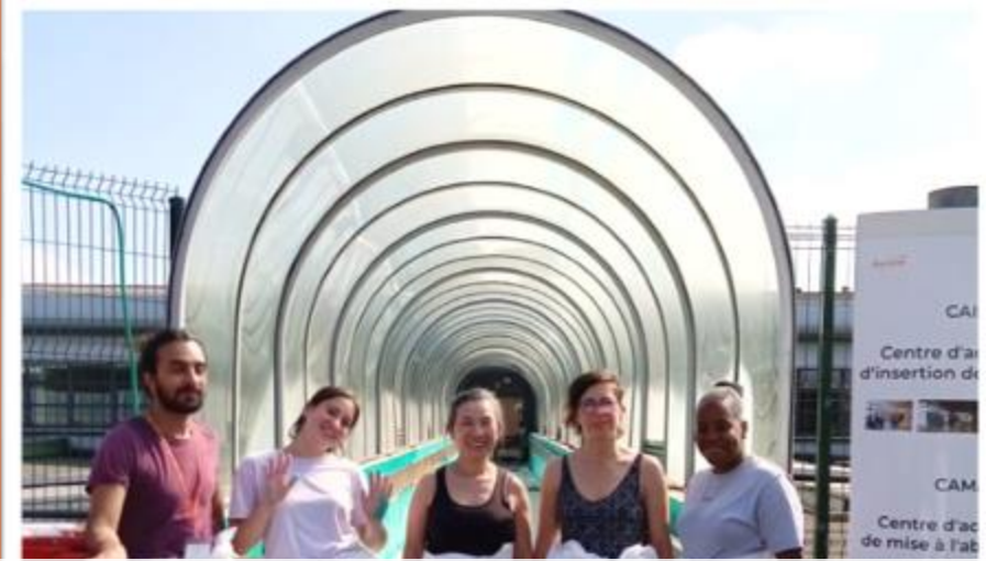
Fondation Santé Service, 13 collaborateurs CAIR/CAMA