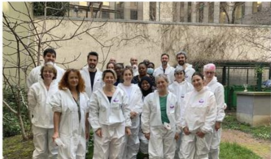
RIVP, 15 collaborateurs PF Vaugirard