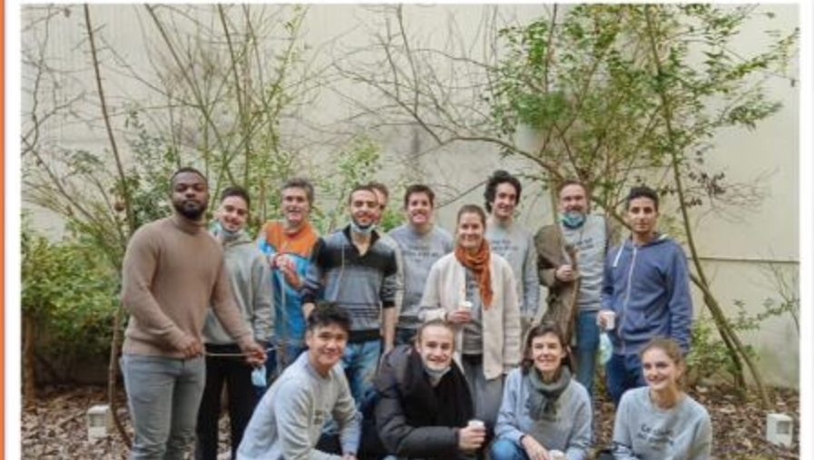
Ressource Consulting, 15 collaborateurs RS/PF Chardon Lagache