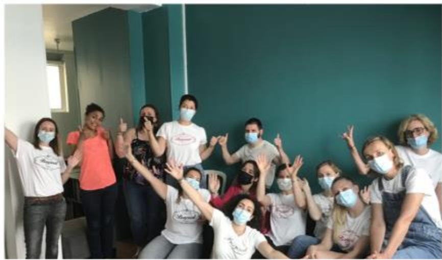
Bonpoint, 11 collaborateurs CHU Suzanne Képès