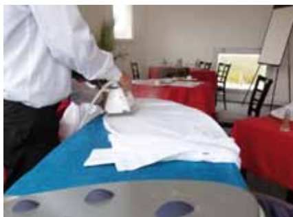
Vocabulaire de la restauration, service, repassage, le plateau technique aborde tous les aspects du métier.