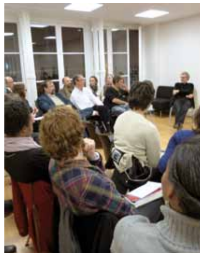
Première rencontre pour les acteurs d'ABC

Le 28 novembre, près d'une trentaine de bénévoles, d'adhérents et de militants ont participé à la première réunion d'Aurore Bénévoles et Citoyens (ABC). Créée en avril 2012, cette association-sœur d'Aurore a pour objets de soutenir les activités de l'association, de contribuer au développement de ses projets et d'accroître sa représentativité et sa reconnaissance. Cette première réunion a été l'occasion de présenter les rôles et enjeux d'ABC, ainsi que ses modalités de fonctionnement.