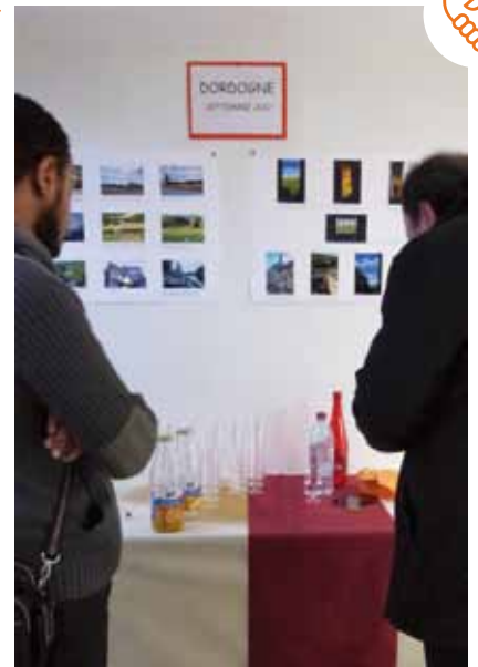
Les photographies du séjour en Dordogne décoraient les murs de PRISM.

Mais cette journée était aussi l'occasion d'inaugurer la dimension nouvelle prise par le service, qui, depuis le début de l'année, a doublé le nombre de personnes suivies, passant ainsi de 450 à 900 personnes et faisant de PRISM le plus important service d'accompagnement de bénéficiaires du RSA de Paris.