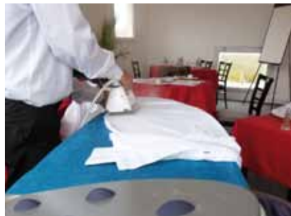
Vocabulaire de la restauration, service, repassage, le plateau technique aborde tous les aspects du métier.