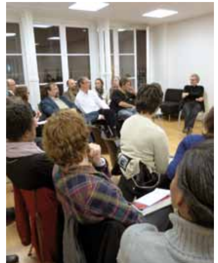
Première rencontre pour les acteurs d'ABC

Le 28 novembre, près d'une trentaine de bénévoles, d'adhérents et de militants ont participé à la première réunion d'Aurore Bénévoles et Citoyens (ABC). Créée en avril 2012, cette association-sœur d'Aurore a pour objets de soutenir les activités de l'association, de contribuer au développement de ses projets et d'accroître sa représentativité et sa reconnaissance. Cette première réunion a été l'occasion de présenter les rôles et enjeux d'ABC, ainsi que ses modalités de fonctionnement.