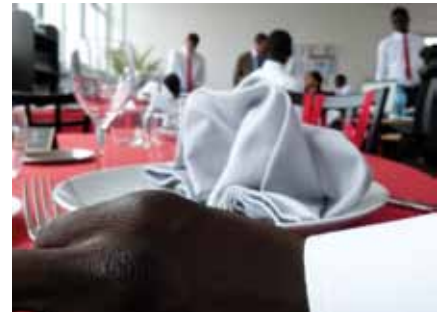
Les élèves visent le dressage impeccable.