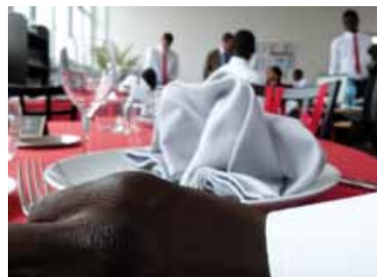
Les élèves visent le dressage impeccable.