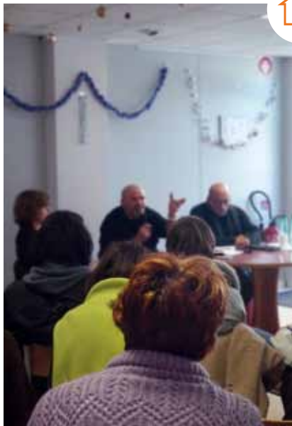
Les conférences reprennent... Ne les manquez pas !