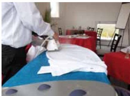
Vocabulaire de la restauration, service, repassage, le plateau technique aborde tous les aspects du métier.