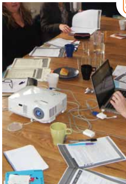
L'Entr'act recevra ses collègues et ses partenaires le 12 octobre 2012.