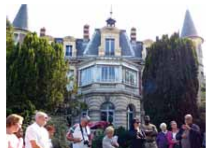
Le bâtiment des Tourelles accueillera en novembre des femmes en difficulté.

Pour mieux répondre aux besoins de ses administrés, le conseil général a lancé un appel à projets ayant pour objectif l'ouverture d'un centre pour femmes accompagnées de leurs enfants de moins de 3 ans. Aurore a présenté un projet de centre d'hébergement d'urgence qui a retenu l'attention du conseil général le 12 septembre