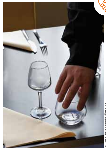
L'Odysée propose de nouvelles formations.