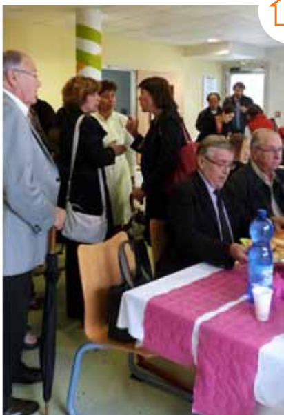
Partenaires institutionnels, bénévoles et résidents de La Colombe, réunis autour d'un déjeuner.

En cette rentrée 2012, deux nouveaux programmes vont venir compléter les ateliers de l'Espace de Dynamique d'Insertion. Le premier, le Passeport pour la citoyenneté , proposera aux jeunes primo-arrivants d'approfondir leurs connaissances des valeurs, de la culture et des lois françaises, au cours de sessions de 3 semaines en groupe d'une dizaine de personnes (l'accueil en EDI peut être d'un an). La formation aura lieu dans un nouvel espace à Montreuil qui sera mutualisé avec les associations APRELIS et Rues et Cité. Les trois structures s'associeront pour proposer également des formations professionnalisantes de 6 à 10 mois: APRELIS assurera l'apprentissage du « français professionnel », Rues et Cité la gestion d'une plateforme sur les métiers du bâtiment et L'Odysée sur les métiers de la restauration. Des programmes adaptés aux réalités du terrain et qui ouvrent de nouvelles perspectives aux jeunes accompagnés par L'Odysée.