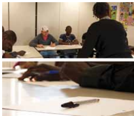
L'atelier « expression française » de l'EDI.