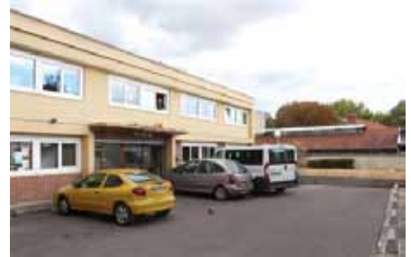
Le bâtiment qui accueille les stagiaires de S'PASSE24

Pour le chef de service de S'PASSE24, Thierry Potel, les EDI sont une première marche vers l'insertion sociale et professionnelle pour des jeunes très éloignés de l'emploi : « Ici, on laisse le temps aux jeunes de se poser et de régler les problèmes qui pourraient les empêcher d'avancer. Pour qu'ils puissent entrer sereinement dans une dynamique de formation et activer ou réactiver les savoirs de base, il faut qu'ils puissent régler leurs problèmes en amont : l'équipe travaille donc sur les questions d'accès aux droits, de logement, de justice. »