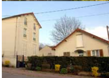
La résidence La Fontaine et la résidence La Montagne située à quelques mètres.