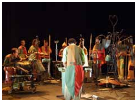
Le Ferrailouz'Bandl, un groupe de percussion composé de valides et non valides