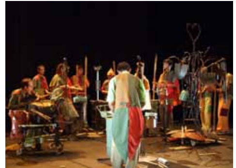
Le Ferrailouz'Bandl, un groupe de percussion composé de valides et non valides