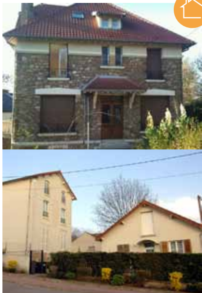
La résidence La Fontaine et la résidence La Montagne située à quelques mètres.

Le 1 er mai 2011, l'association Aurore a repris la gestion de la résidence La Fontaine, située au Raincy et gérée précédemment par l'association Interlogement, dont Aurore est membre du conseil d'administration. Le CA d'Interlogement avait voté l'arrêt de la gestion locative et Aurore s'est positionnée sur cette structure. Composée de 8 logements (T1 à T3), le bâtiment en meulière accueille, pour deux ans maximum, des familles monoparentales ou en couple, avec ou sans enfant et des personnes seules, orientées par le Conseil Général de Seine-Saint-Denis. Compte-tenu de leur proximité, La Fontaine a pu être rattachée à la résidence sociale La Montagne (située à 150 mètres) et le poste d'agent d'accueil a pu être mutualisé. Les personnes sont accompagnées par un travailleur social qui les soutient dans l'élaboration de leur projet social et professionnel pour aller vers le logement de droit commun.