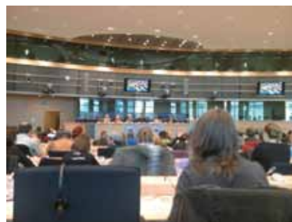
Débat au Parlement européen