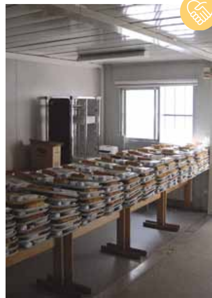
Les plateaux repas du restaurant social Chevaleret qui sert près de 400 repas par jour