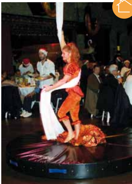
Noël festif au Musée des Arts Forains

Le pôle Insertion professionnelle a répondu à un appel à projet pour porter 8 postes de chargés d'insertion PLIE (Plan Local d'Insertion par l'Économique) Paris Nord Est qui accompagnent chaque année plus de 500 bénéficiaires des 18 ème et 19 ème arrondissements vers la formation, l'emploi et la création d'entreprise.