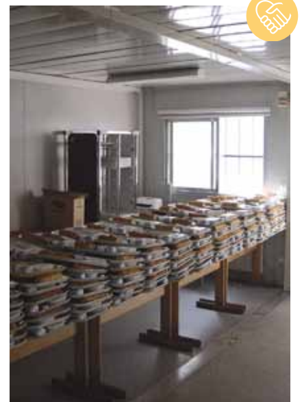
Les plateaux repas du restaurant social Chevaleret qui sert près de 400 repas par jour