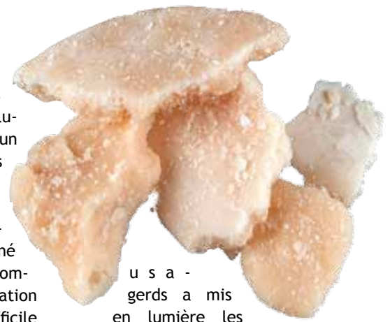
usagers a mis en lumière les

Les résultats de cette action étaient époustouflants. La fréquentation du programme a monté en flèche et elle n'est plus jamais descendue au niveau antérieur, les échanges avec les usagers ont amélioré leurs connaissances sur les risques liés à la consommation de crack et ont diminué le partage du doseur ainsi que le nombre de blessures aux lèvres. L'acceptation d'un kit de prévention pour fumeurs de crack a pris du temps, mais quelques mois après le début de la distribution, d'autres structures parisiennes ont également adopté le kit, ou une variante. Le contact accru avec ces